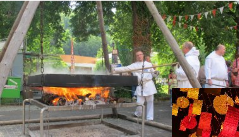
Traditionelles Salzsieden am Pfingstsonntag im Kurpark von Bad Sooden-Allendorf