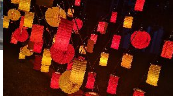
Beleuchtung im Kurpark am Pfingstsonntag